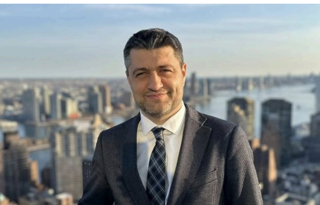
Посол України на Кіпрі Сергій Ніжинський

Підставою стала відсутність суттєвих результатів у роботі, пасивність посла та створення ним репутаційних ризиків для України.