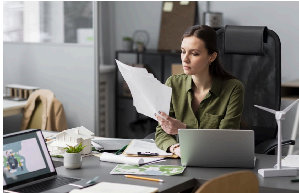
ДПС скоротила кількість перевірок бізнесу

Державна податкова служба змінила підхід до контролю підприємств, зосередивши увагу на якості, а не на кількості перевірок. Застосування ризик-орієнтованого підходу дозволяє концентрувати увагу на діяльності тих суб'єктів господарської діяльності, які мають ризики несплати податків