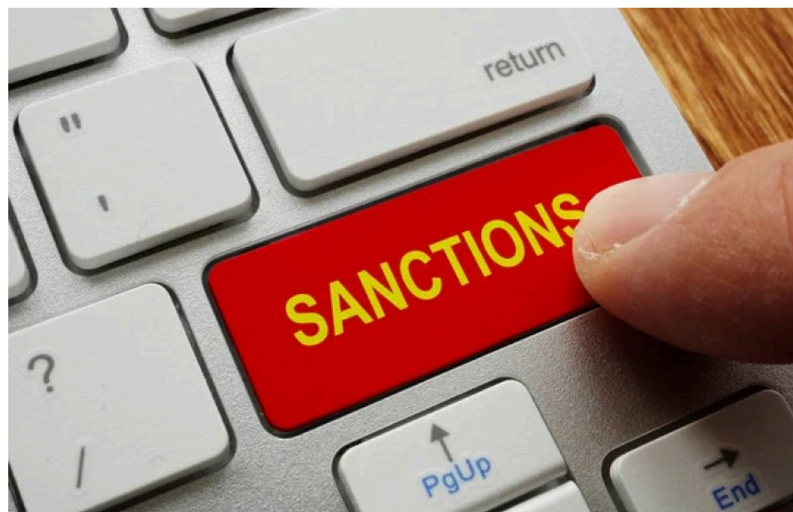
ЄС ще на рік продовжив санкції проти РФ за анексію Криму

Рада Європейського Союзу ухвалила рішення продовжити до 23 червня 2027 року санкції, запроваджені у відповідь на незаконну анексію Росією українських Криму та Севастополя.