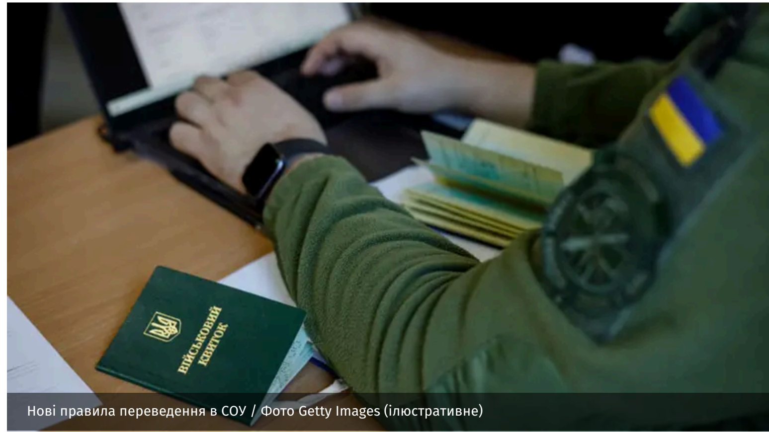
Нові правила переведення в СОВ

Реформа служби у Силах оборони передбачає зміни у переведенні військовослужбовців між підрозділами та бригадами. Наразі Міністерство оборони України завершує розробку відповідного механізму з Генштабом ЗСУ.