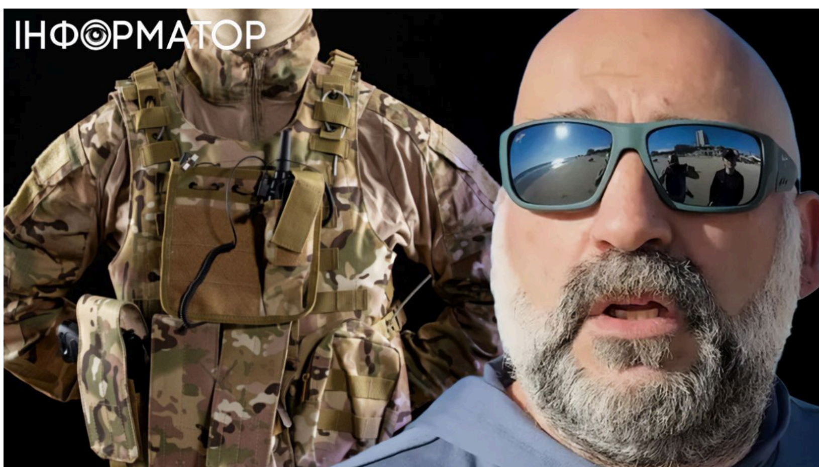
Суд стягнув понад 97 млн за бронжилети Міндіча

Господарський суд міста Києва ухвалив рішення у справі про постачання неякісних бронжилетів для армії - з компанії, пов'язаної з бізнесменом Тимуром Міндічем, стягнули понад 97 мільйонів гривень штрафів. Раніше схеми Міндіча в оборонних закупівлях ми детально розбирали. Справа слухалась у закритому режимі за клопотанням представника Агенції оборонних закупівель.