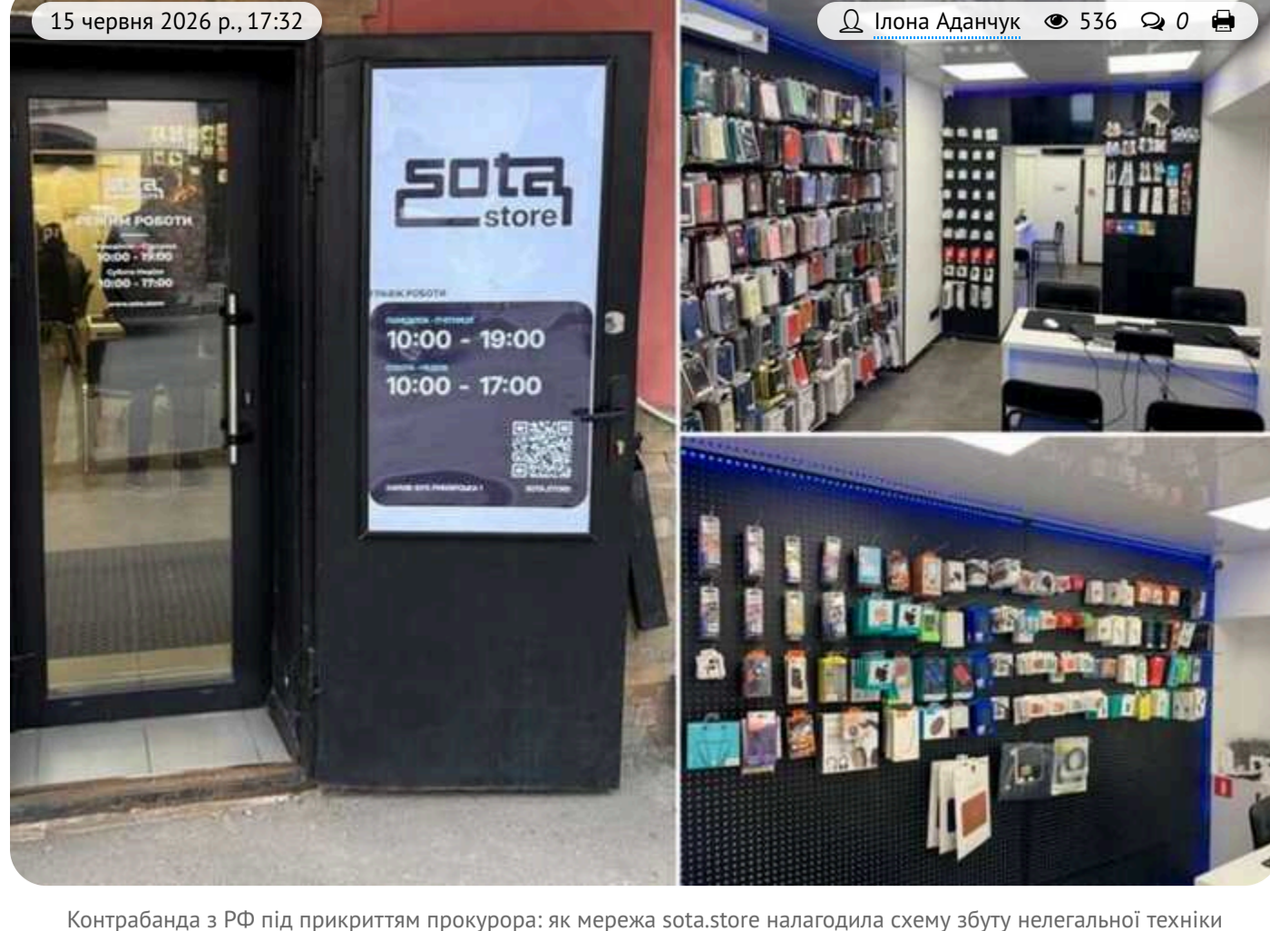
Контрабанда з РФ під прикриттям прокурора: як мережа sota.store налагодила схему збуту нелегальної техніки

Прокурор разом із групою чиновників вирішив заробити на схемі дроблення бізнесу через мережу магазинів sota.store, яка походить із Харкова.