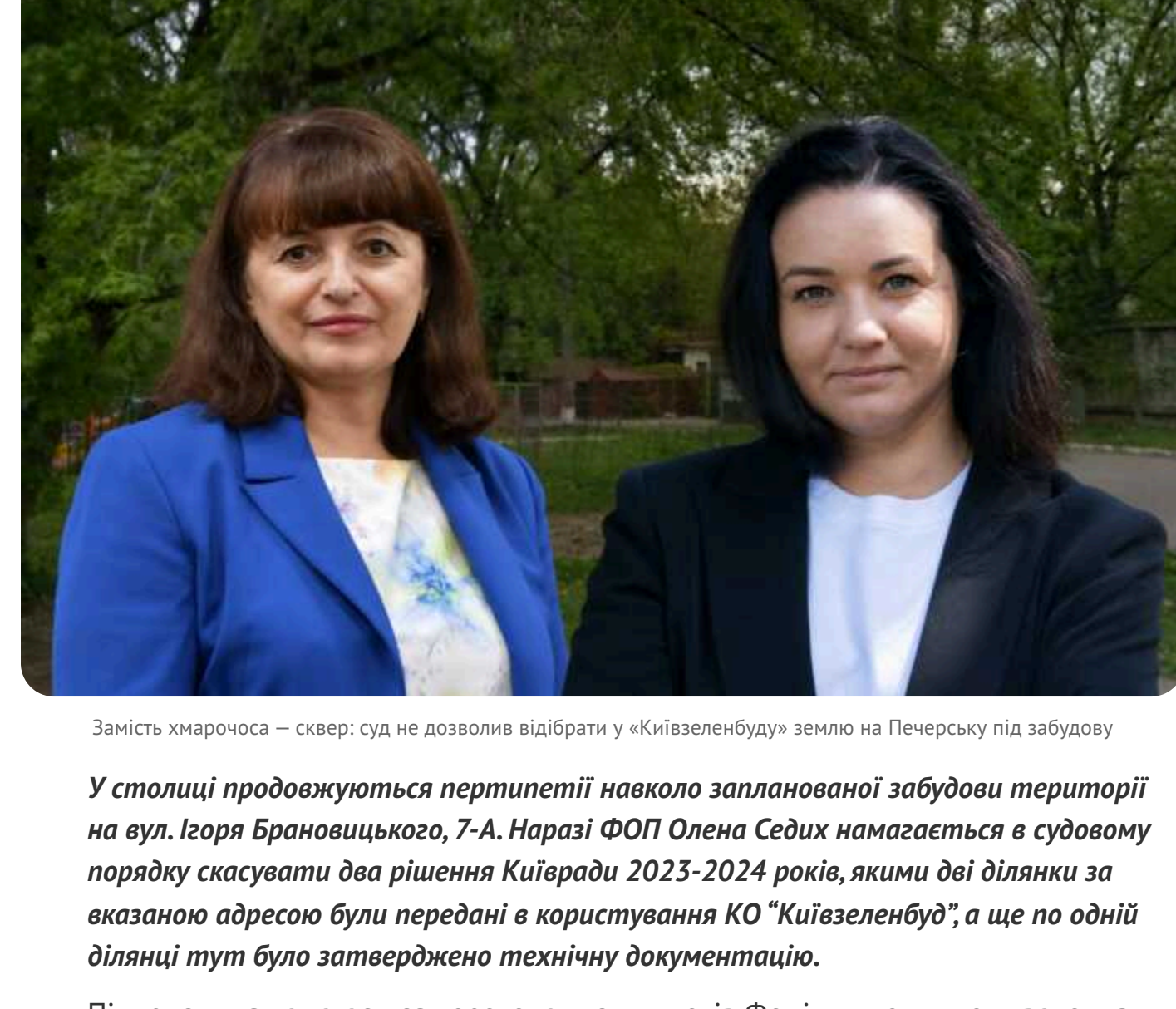
Замість хмарочоса – сквер: суд не дозволив відібрати у «Київзеленбуду» землю на Печерську під забудову