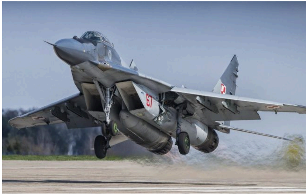
Фото: польський винищувач МіГ-29