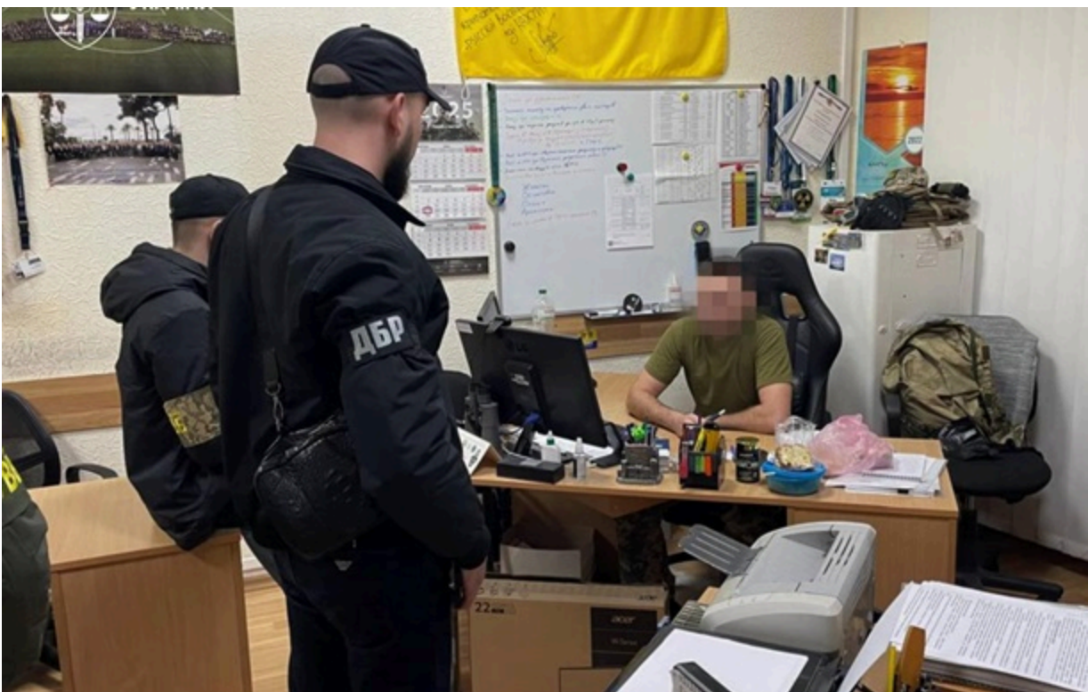
Справу передано до суду

Фігурант разом із двоюрідним братом - громадянином РФ - організував схему незаконного переправлення військовозобов'язаних чоловіків до країн ЄС.