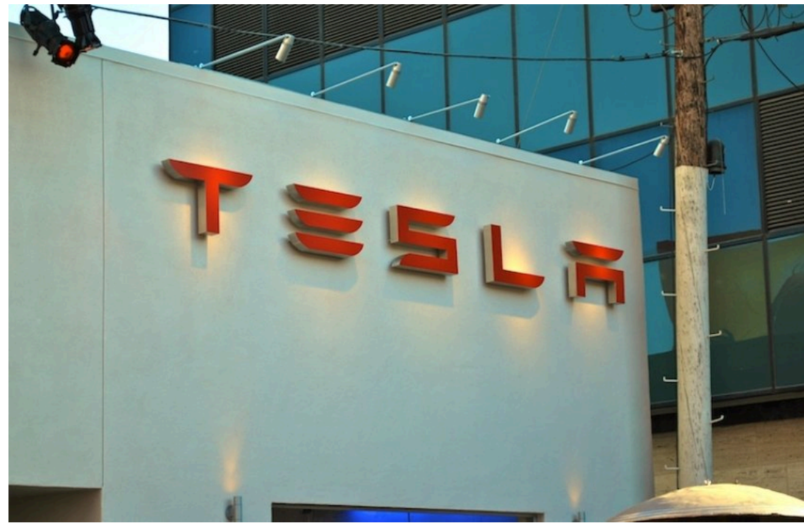
Tesla надала регуляторам ЄС сумнівні дані про безпеку свого автопілота

Американський виробник електромобілів Tesla надав регуляторним органам Нідерландів та Швеції некоректну статистику безпеки своєї системи Full Self-Driving (FSD). Компанія намагається отримати сертифікацію технології на європейському ринку, проте незалежні експерти з безпеки дорожнього руху вже назвали надані цифри "оманливим маркетингом".