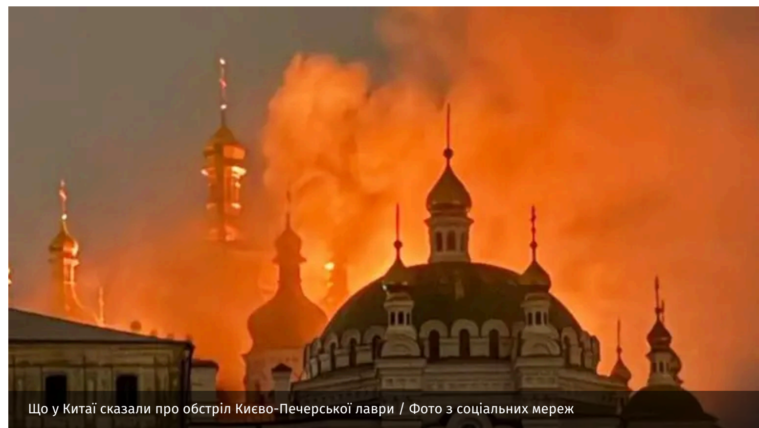
Що у Китаї сказали про обстріл Києво-Печерської лаври

Китай після масованого російського обстрілу столиці в ніч на 15 червня та атаки на Києво-Печерську лавру заявив про підтримку мирних переговорів. У Пекіні закликали "всі сторони" конфлікту створити умови для його політичного врегулювання.