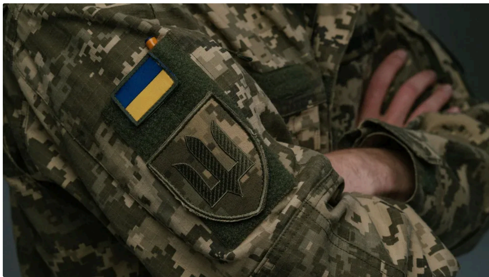
Реформа ТЦК буде спрямована на тих, хто перебуває в розшуку

15 червня, 16.56 🗨️ Этот материал также можно прочитать на русском