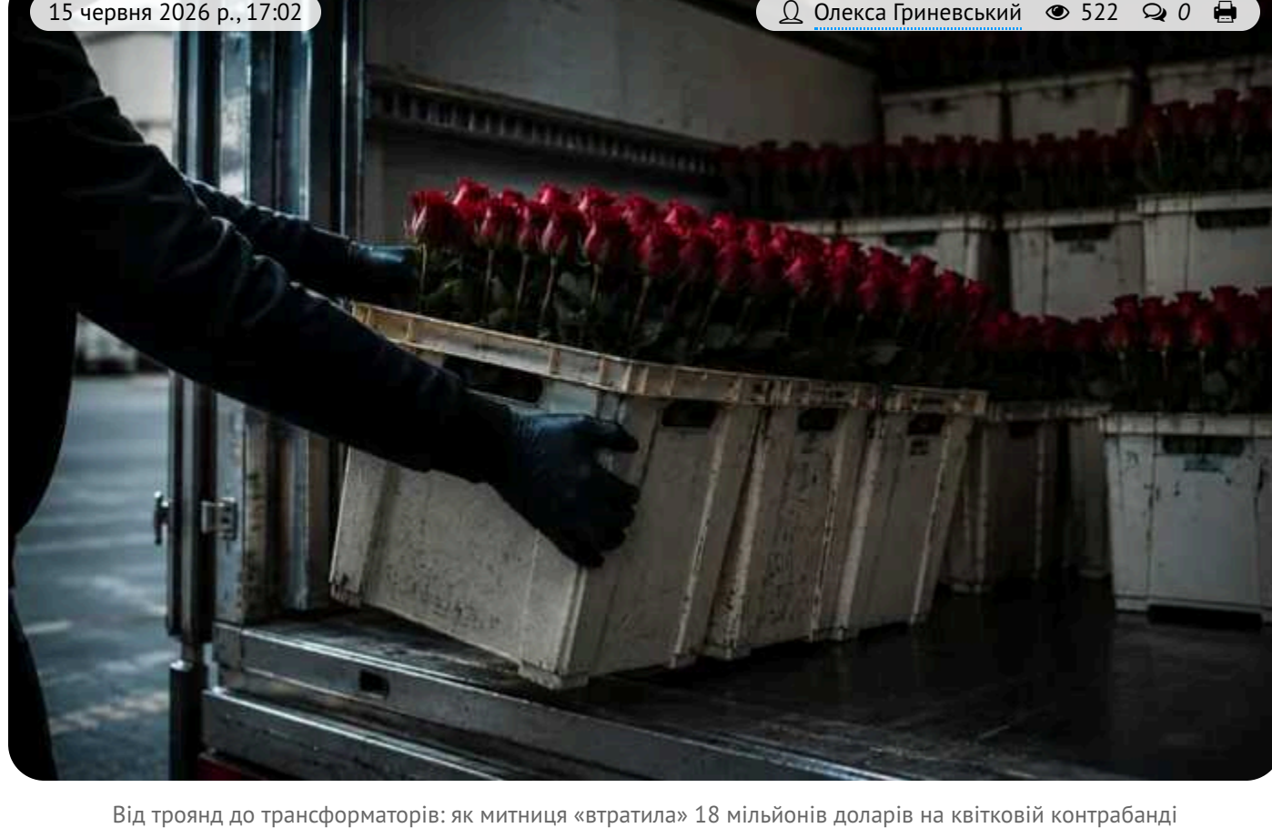
Від троянд до трансформаторів: як митниці «втратили» 18 мільйонів доларів на квітковій контрабанді