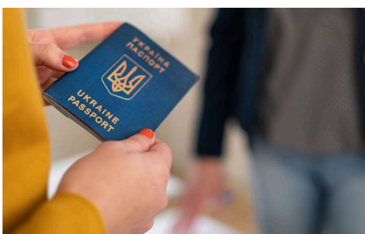
Фото: Закордонний паспорт (Getty Images)

Не витрачай час на шум! Читай тільки суть з РБК-Україна у Google