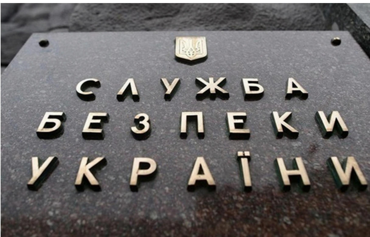
Фото: СБУ (ілюстраційне фото). В СБУ повідомили подробиці справи

Для виконання завдання ворога зловмисник придбав вогнезахисні рукавиці та каністру з легкозаймистою сумішшю, яку мав вилити на технологічне обладнання Укрзалізниці і підпалити