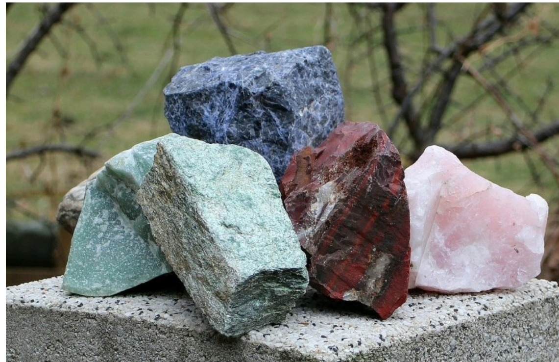
Українізниця позбулася права на видобуток андезиту

Державна служба геології та надр України погодила передачу спеціального дозволу на користування Кам'янецьким родовищем андезиту в Закарпатській області від АТ "Українізниця" до ПрАТ "Краматорський завод важкого верстатобудування". Дозвіл на видобуток сировини для побутового каменю та щебеню діятиме до 2037 року.