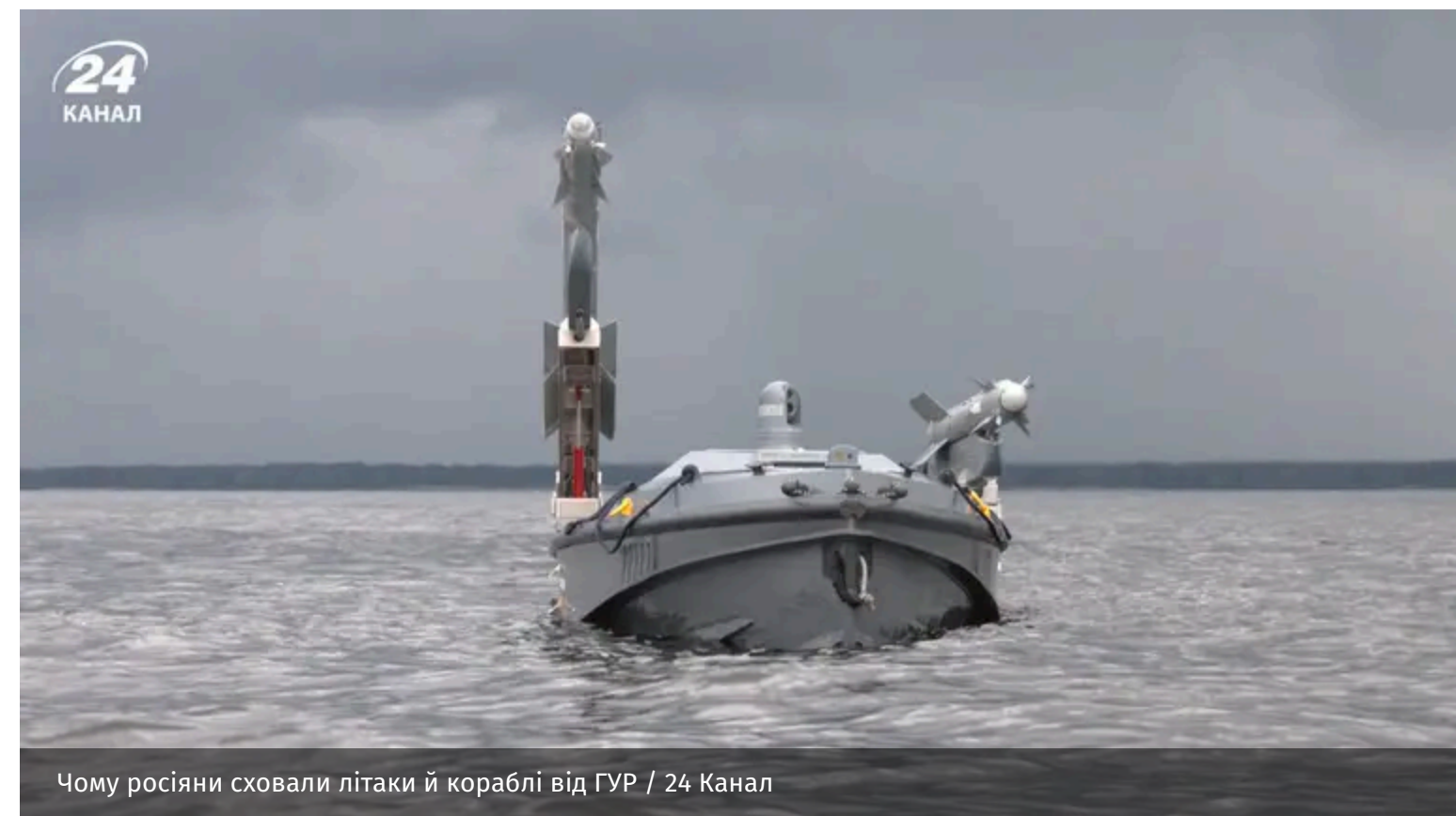
Чому росіяни сховали літаки й кораблі від ГУР

Морський дрон Magura став повноцінною бойовою платформою і кардинально змінив ситуацію на морі. Наразі Чорноморський флот фактично заблоковано, а російські бойові судна переховуються.