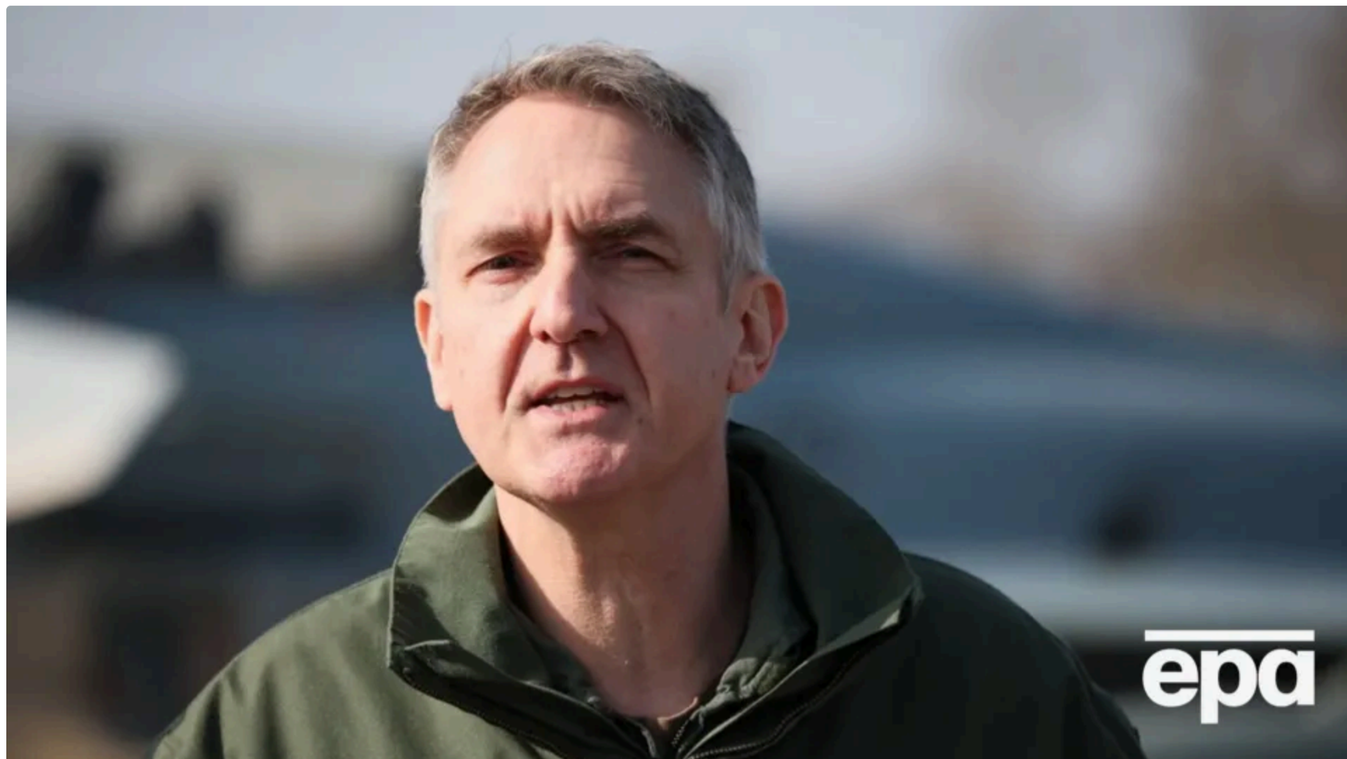
Нойман наголосив, що йдеться про удари в відповідь

15 червня, 15.57 🗨️ Этот материал также можно прочитать на русском