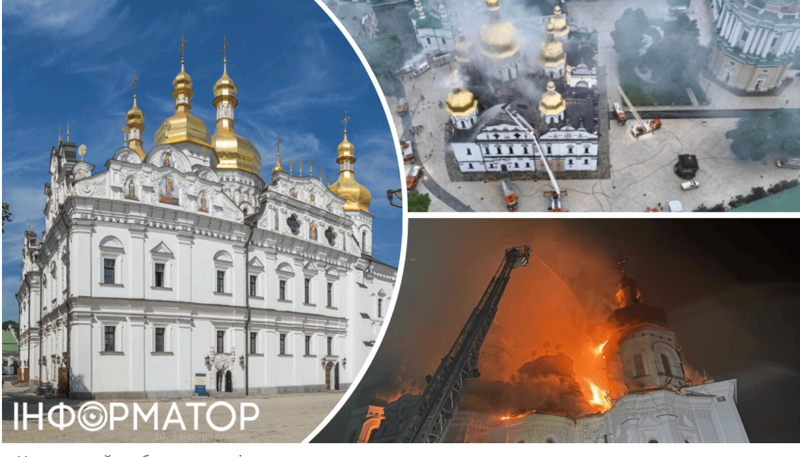
Успенський собор - що відомо про святиню

У ніч на 15 червня російський дрон-камікадзе влучив в Успенський собор Києво-Печерської лаври - одну з найдавніших святинь України. Ближні печери Лаври вже закривали для відвідувачів після попередніх пошкоджень - тепер черга дійшла до головного собору. Цей храм пережив монголо-татарські навали, польсько-литовські часи, пожежу XVIII століття та руйнацію 1941 року - і щоразу відроджувався. Нині йому знову загрожує знищення - цього разу від рук росіян.