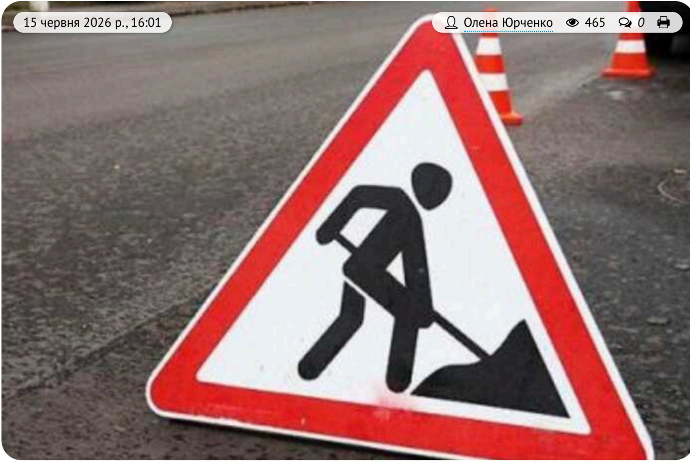
Сотні мільйонів державних коштів: як підряд на стратегічну дорогу без реальної конкуренції віддали субпідряднику «Ростдорстрою»

Дорожнє будівництво в умовах воєнного стану: Кіровоградська Служба відновлення замовила ремонт стратегічної траси Н-14 на суму майже 450 млн грн. Підрядником виступило ТОВ «Асфальтно-бетонний завод «Єробуд-Асфальт».