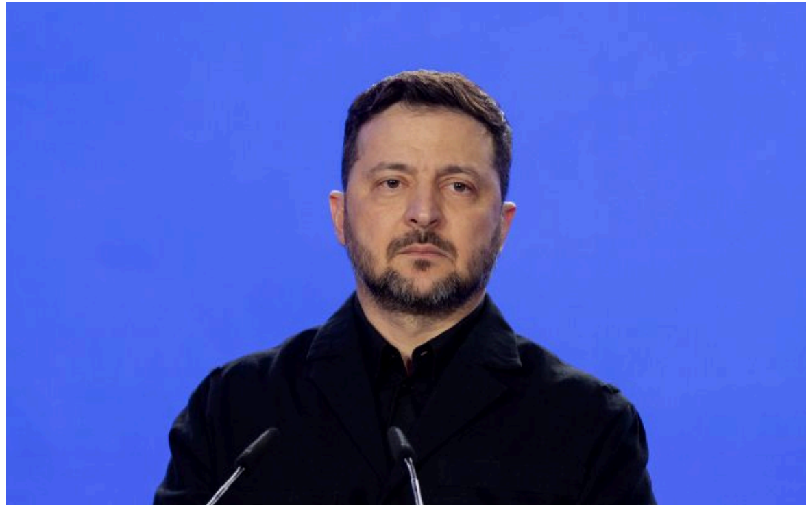
Фото: Володимир Зеленський, президент України