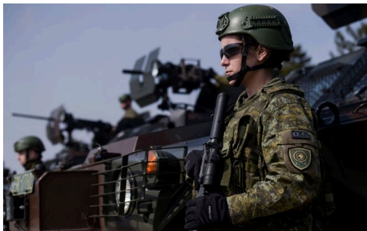
НАТО відповість на агресію негайно