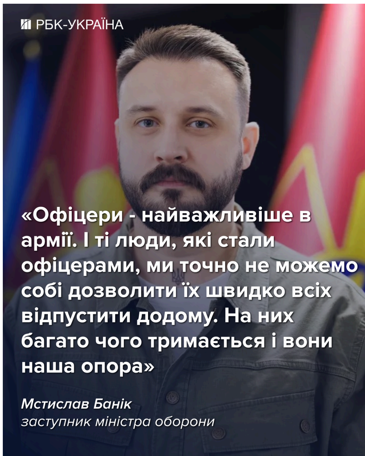
Фото: Банік прокоментував можливість демобілізації офіцерів (РБК-Україна)

"Офіцери - це найважливіше в армії. І тих, хто став офіцером, ми точно не можемо собі дозволити швидко відпустити додому. Від них багато чого залежить, і вони - наша опора", - сказав Банік.