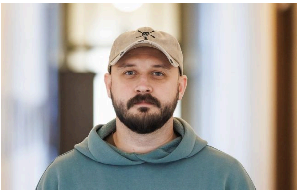
Фото: Мстислав Банік, заступник міністра оборони України (facebook.com/mstyslavbanik)