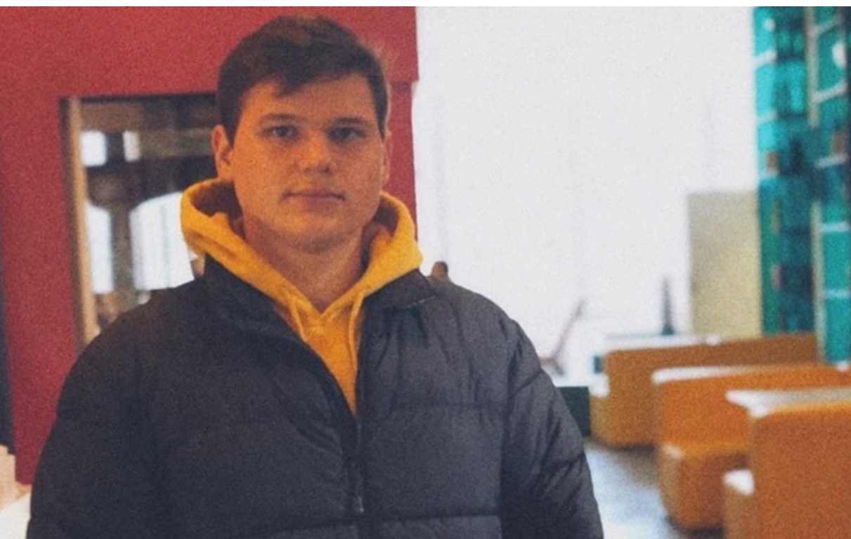
Фото: instagram.com/porjadin'skiy Олександр Порядинський

Наразі співак проходить базову загальновійськову підготовку та тимчасово призупинив активну творчу діяльність.