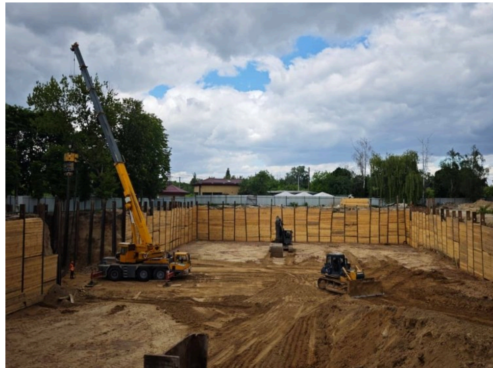
Будівництво ЖК у Гостомелі

Проєкт передбачає зведення житлового комплексу із семиповерхових будинків на 360 квартир. Раніше на цій території розташовувалися будинки на 272 квартири, які зазнали руйнувань.