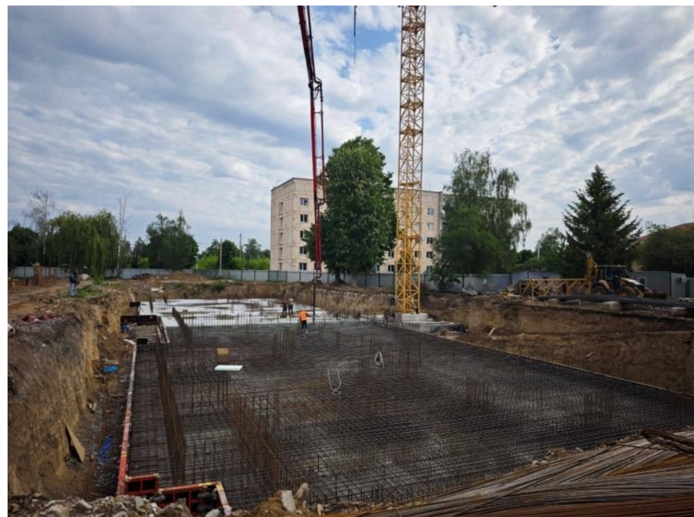
Будівництво ЖК у Гостомелі

Складовою проєкту стане споруда подвійного призначення із захисними властивостями протирадіаційного укриття. У мирний час вона функціонуватиме як спортивний комплекс, а в разі небезпеки слугуватиме укриттям для мешканців. Загальна площа споруди становитиме понад 2,1 тис. м 2 , а одночасно перебувати тут зможуть 1212 осіб.