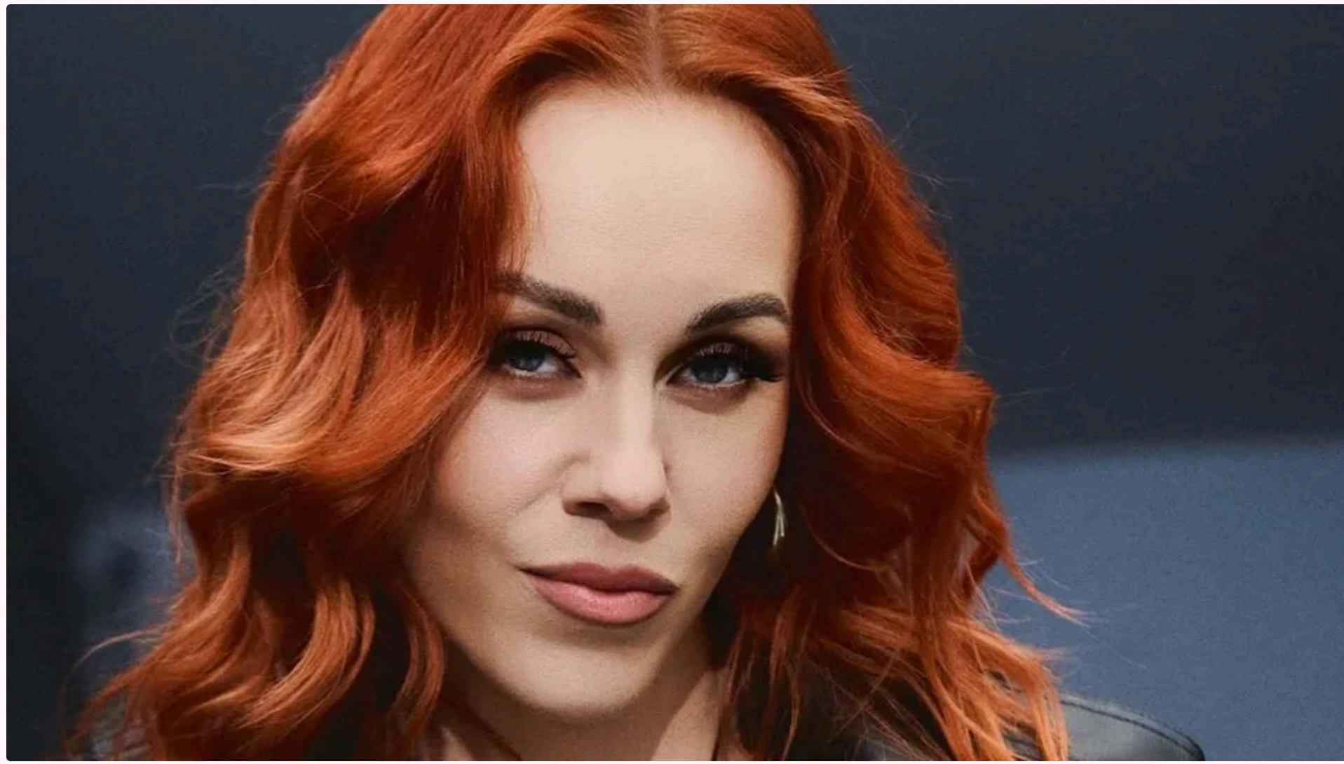
Олена Тополя – мати трьох дітей

Українська співачка Олена Тополя зізналась, що перед розлученням зі своїм чоловіком, українським артистом Тарасом Тополею пережила складний період. Про це вона розповіла в інтерв'ю, яке опублікували на YouTube-каналі "FM Галичина".