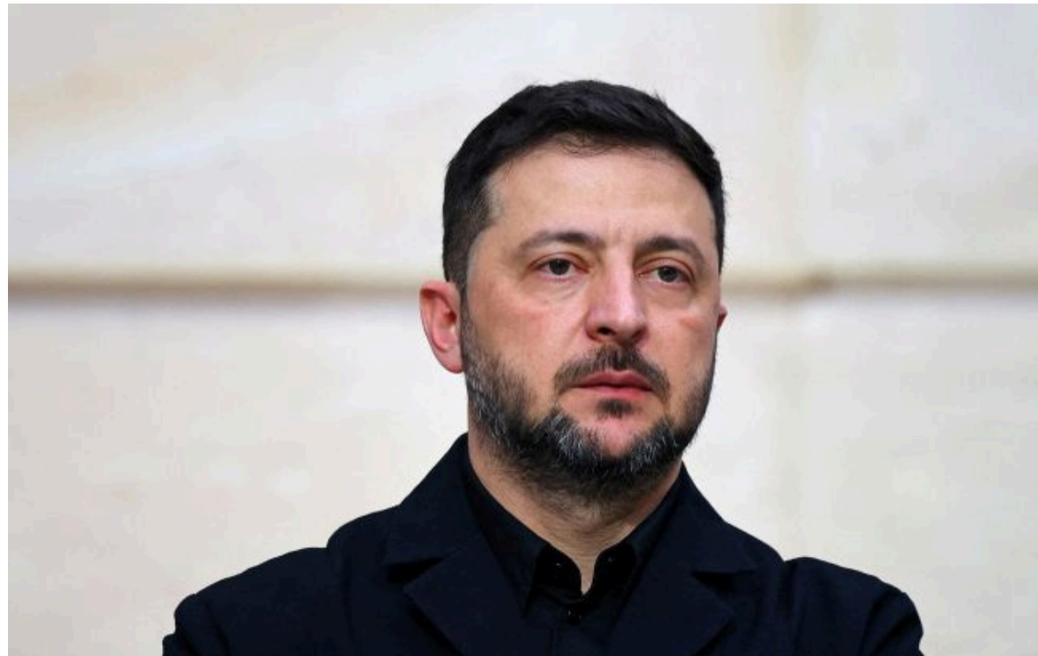
Фото: Володимир Зеленський (Getty Images)