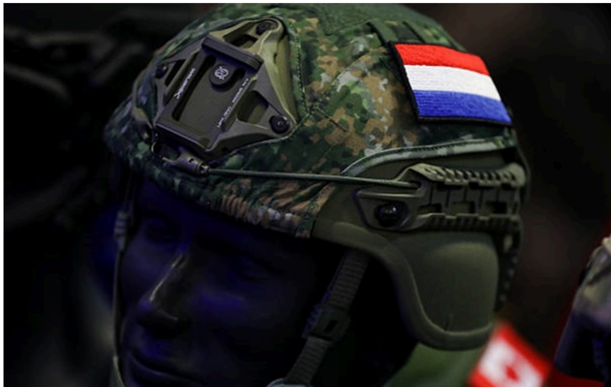
Армія Нідерландів натреноує нові навички на випадок конфлікту

Нідерланди натреновують досвід в утриманні полонених. Востаннє подібні навчання проводилися ще за часів холодної війни.