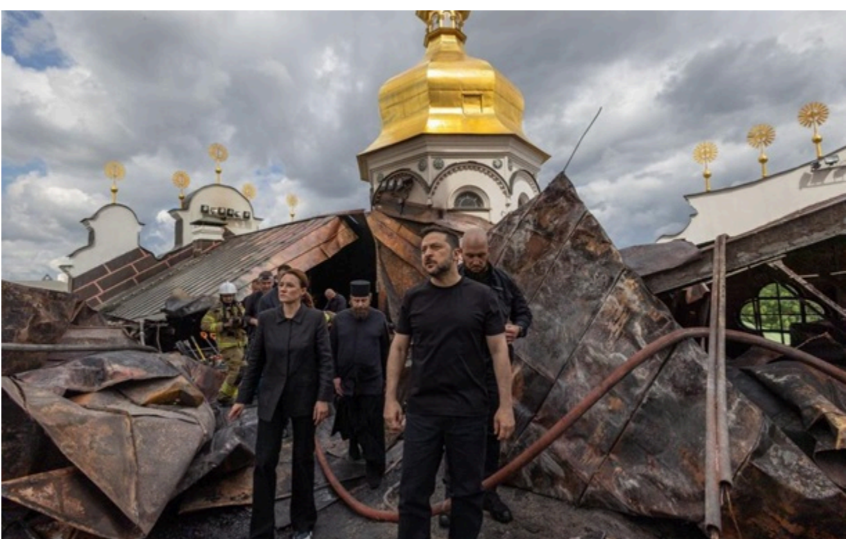
Фото: Пресслужба президента України Володимир Зеленський на даху Успенського собору Києво-Печерської лаври

Рятувальники вже ліквідували пожежі, які виникли внаслідок російських обстрілів в Печерському районі.