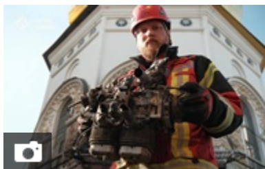
СБУ показала уламки "шахеда", що вдарив по лаврі 13:34