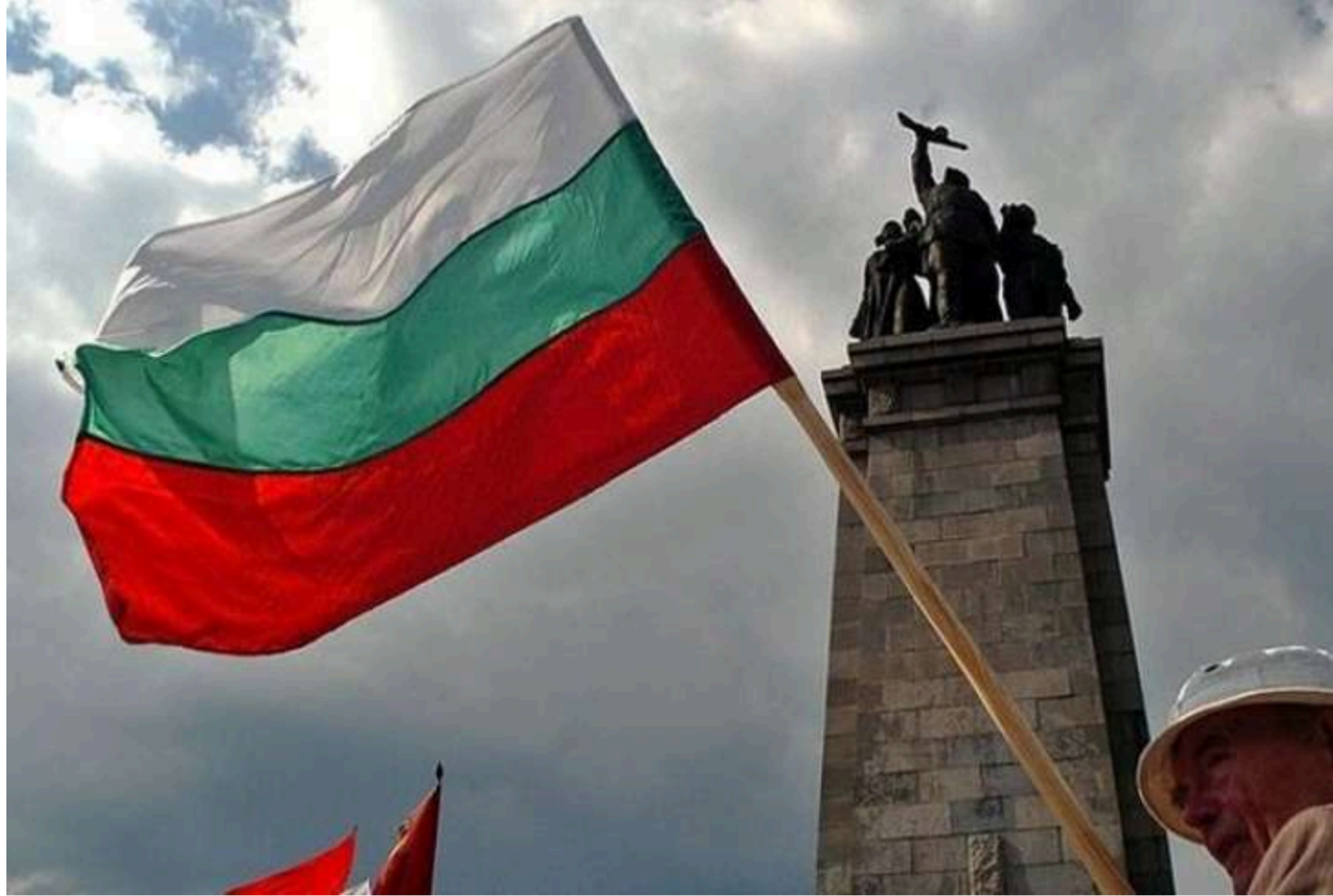
Ілюстративне фото з відкритих джерел

Болгарський уряд схвалив національний план щодо поступового збільшення витрат на оборону до 5% ВВП країни до 2035 року. Про це повідомляє Novinite із посиланням на Раду міністрів Болгарії.