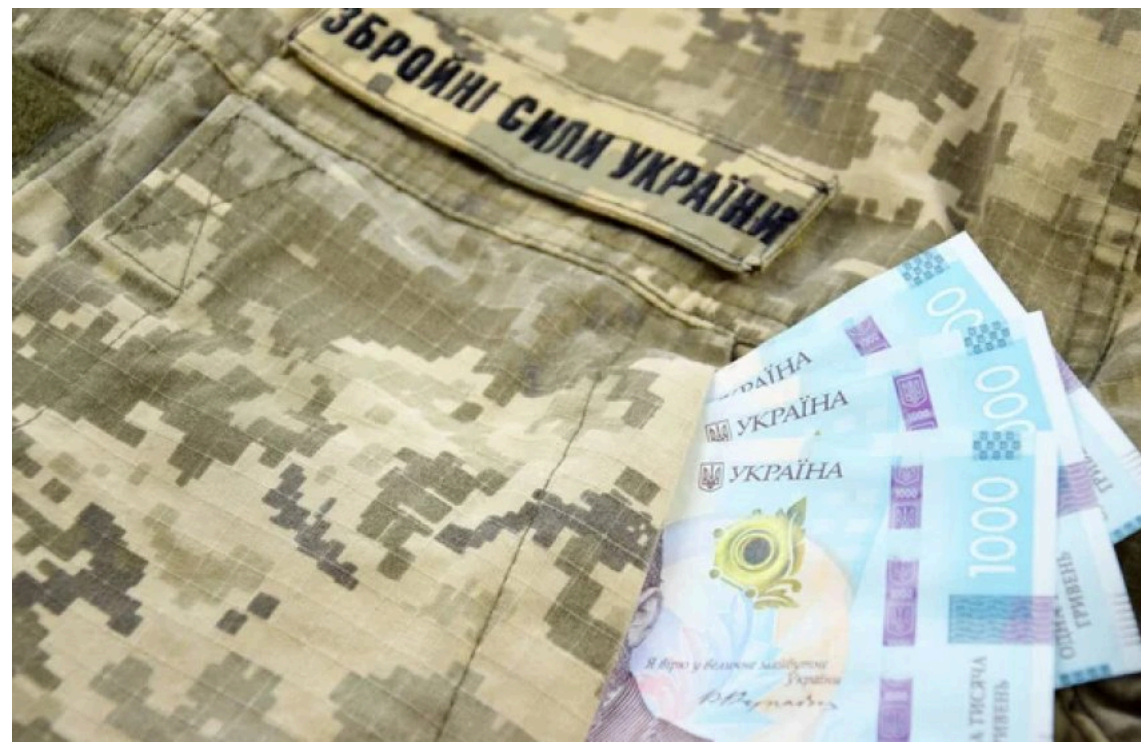
Платники податків збільшили сплату військового збору

За перші п'ять місяців поточного року надходження від військового збору до державного бюджету України сягнули 77,4 млрд грн.