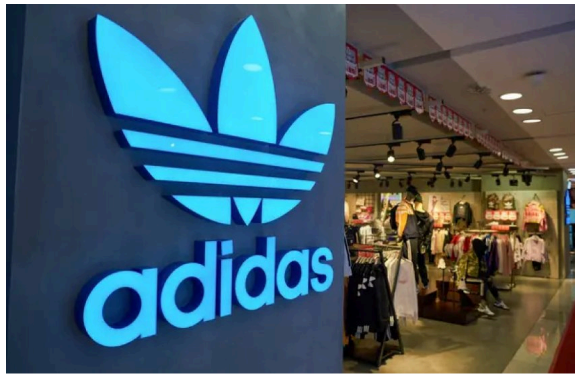
Adidas відновив роботу в Харкові після чотирирічної перерви

Спортивний бренд Adidas відновив роботу в Харкові після чотирирічної перерви. У місті відкрився магазин у форматі дисконт-центру, розташований на вулиці Героїв Харкова, 199.