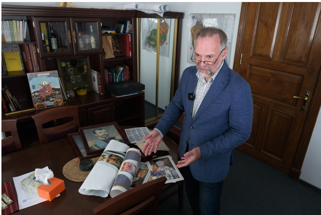
Російські пропагандистські матеріали, які виявили у Лаврі