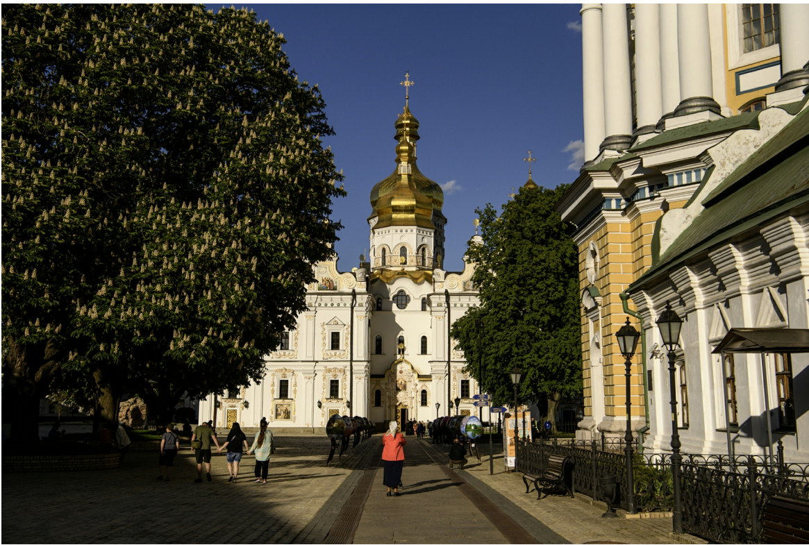
Успенський собор

В Андріївському приділі перед самим початком повномасштабного вторгнення було зроблено розписи в імперському стилі, що прославляють російську традицію та діячів, які пов'язані з підтримкою російського мілітаризму.