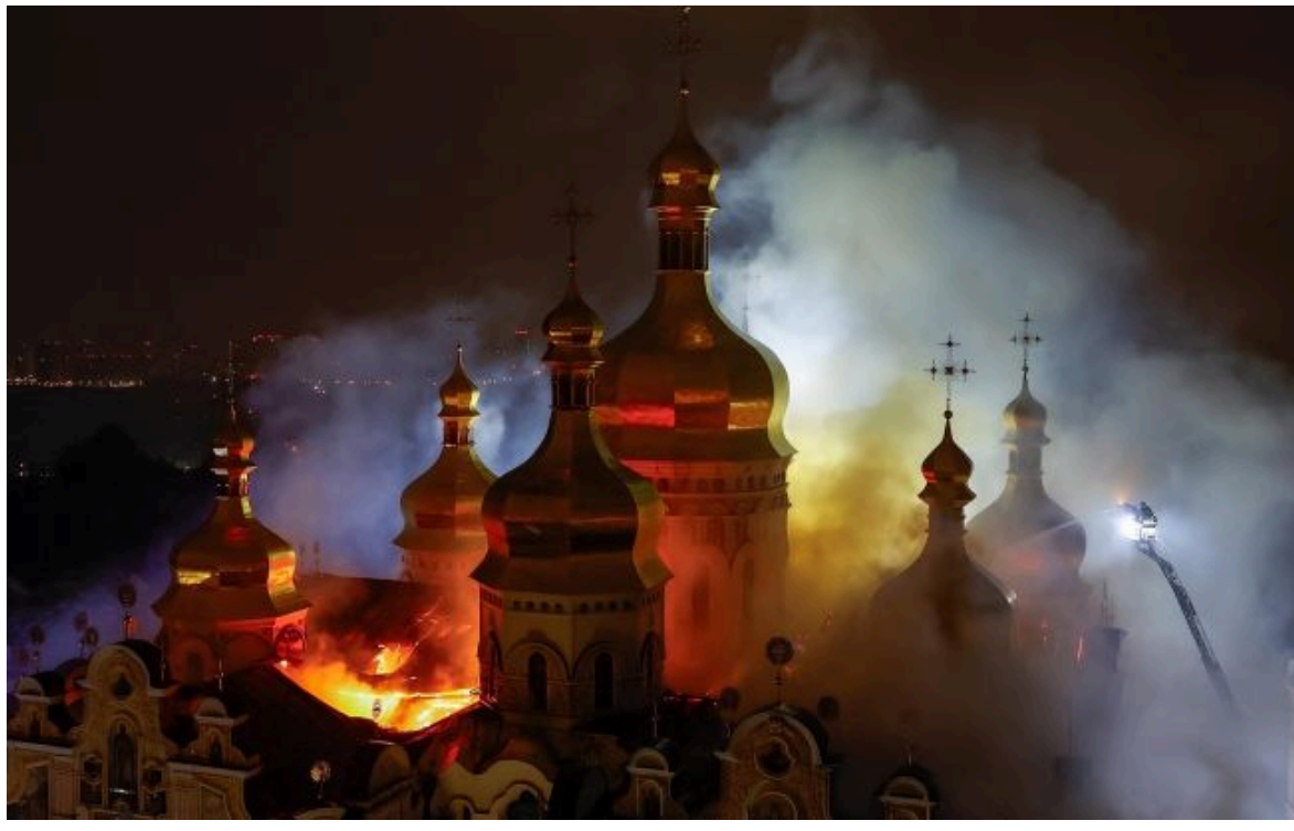
Фото: пожежа у Києво-Печерській лаврі 15 червня (t.me/data_telegram)

Розумій ситуацію на фронті через факти, а не чутки з РБК-Україна у Google