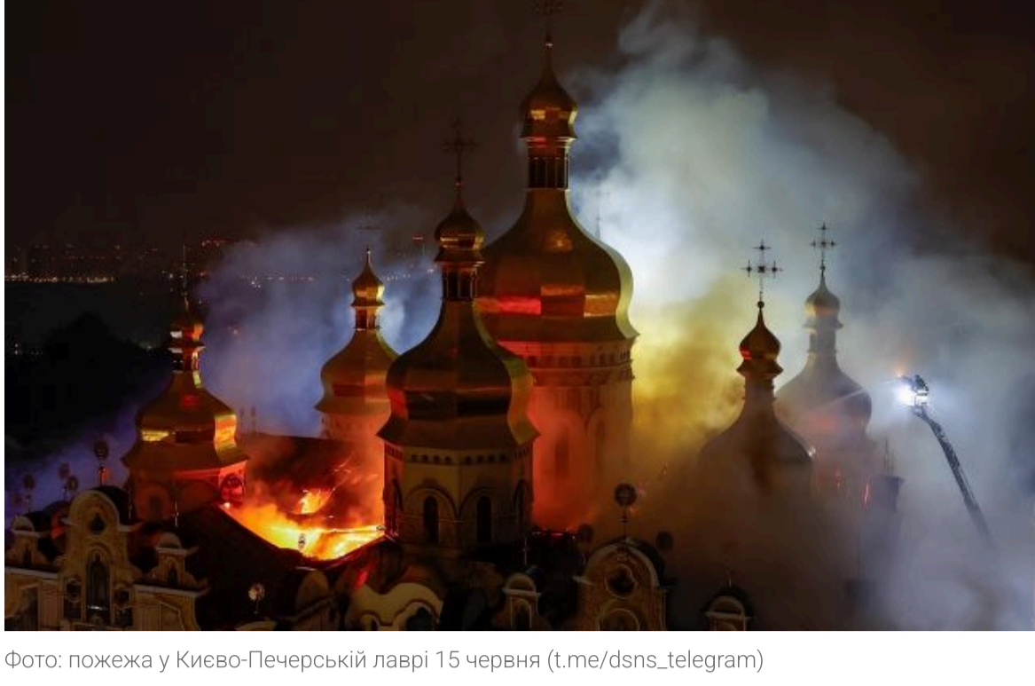
Фото: пожежа у Києво-Печерській лаврі 15 червня