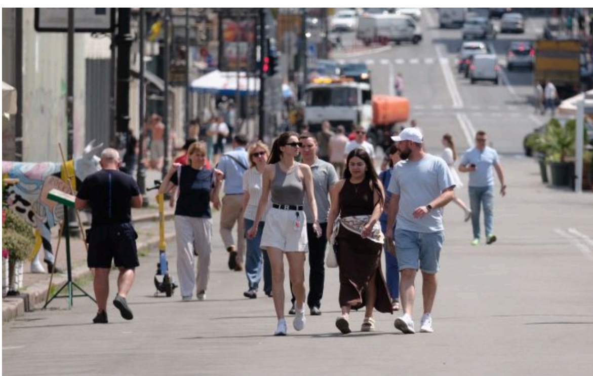
Фото: більшість українців проти офіційного статусу російської мови (Віталій Носач, РБК-Україна)

Не витрачай час на шум! Читай тільки суть з РБК-Україна у Google