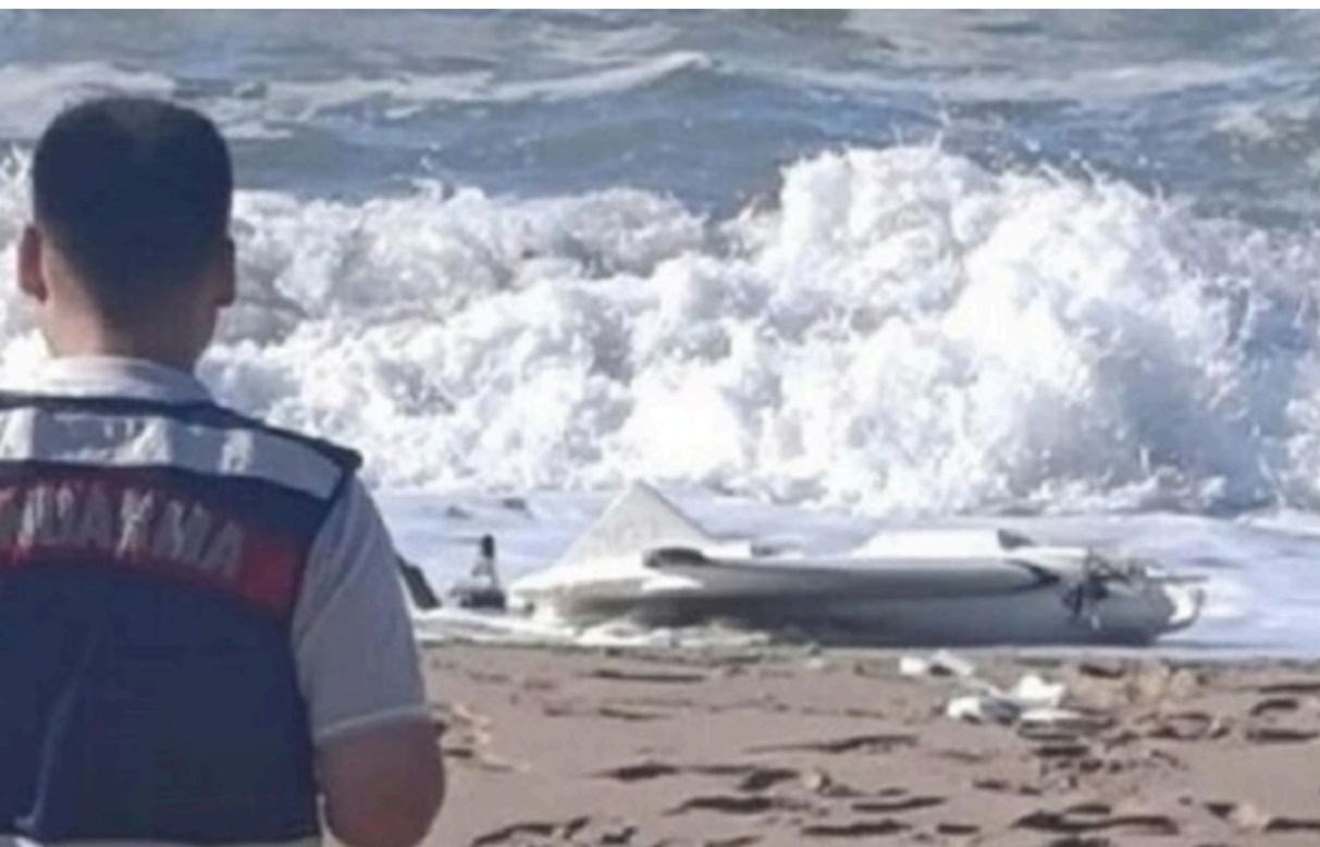
Озброєний дрон із боєприпасами винесло на узбережжя Туреччини

Походження безпілотника та обставини його появи біля турецького узбережжя наразі встановлюються.