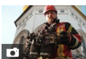
СБУ показала уламки "шахеда", що вдарив по лаврі