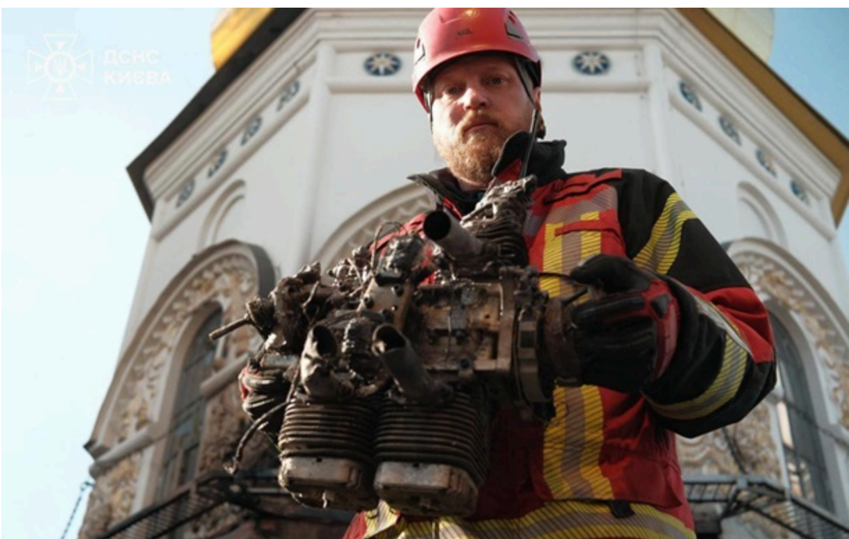
Фото: ДСНС. Дригун від російського дрона, який вдарив по Києво-Печерській Лаврі.

Окремі його комплектуючі дрона виготовлено на території РФ в особливій економічній зоні Алабуга.