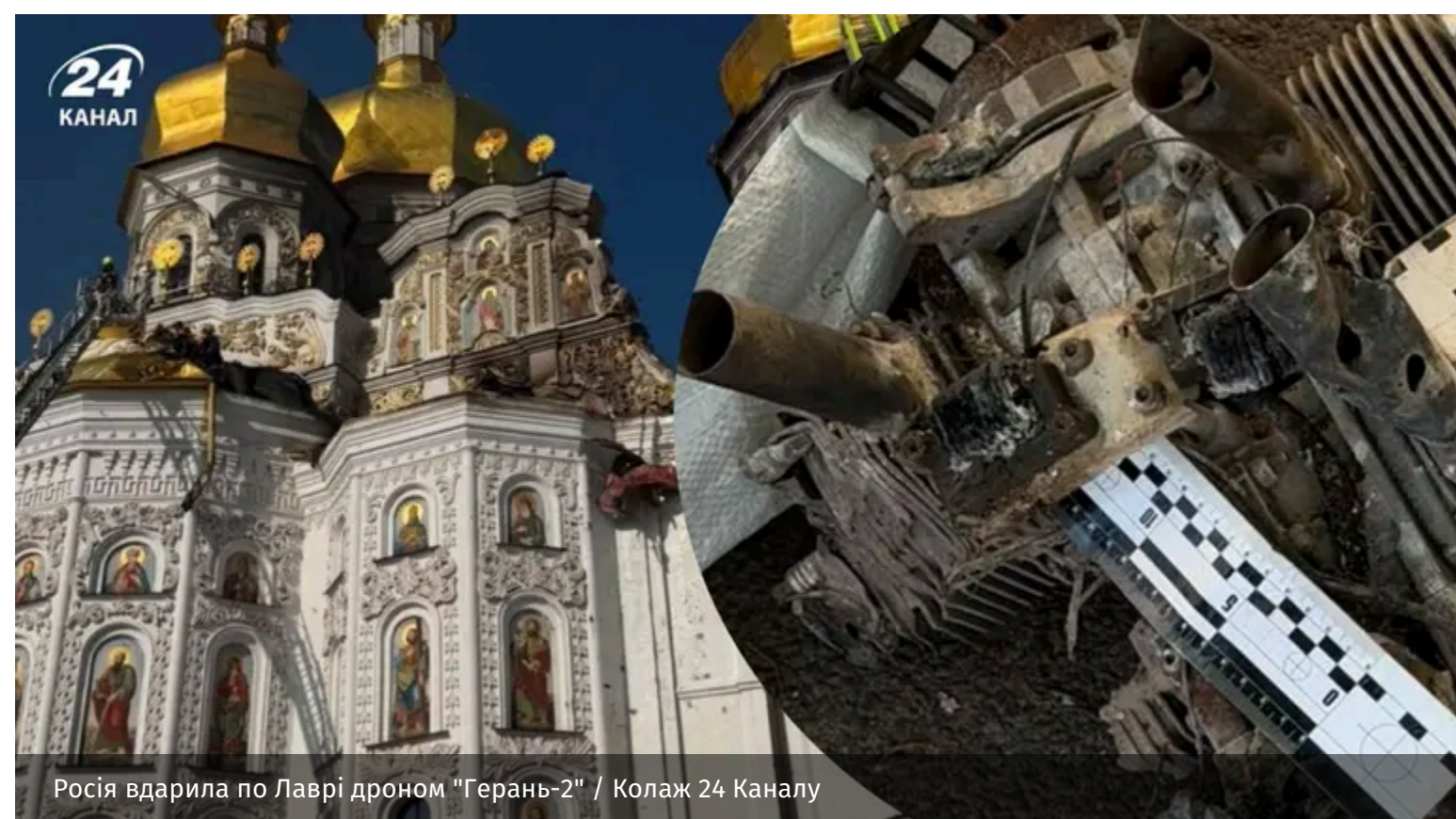
Росія вдарила по Лаврі дроном "Герань-2"

15 червня під час масованої атаки Росія вдарила по Успенському собору Києво-Печерської Лаври. Ворог використав дрон "Герань-2", яка є аналогом іранського "Шахеда".