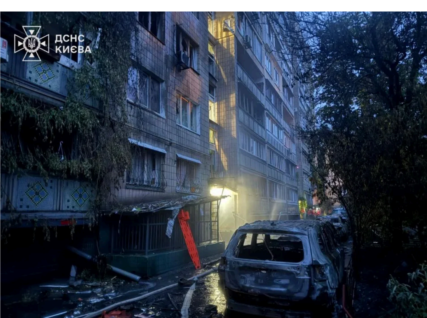
Росія атакувала цивільну інфраструктуру Києва