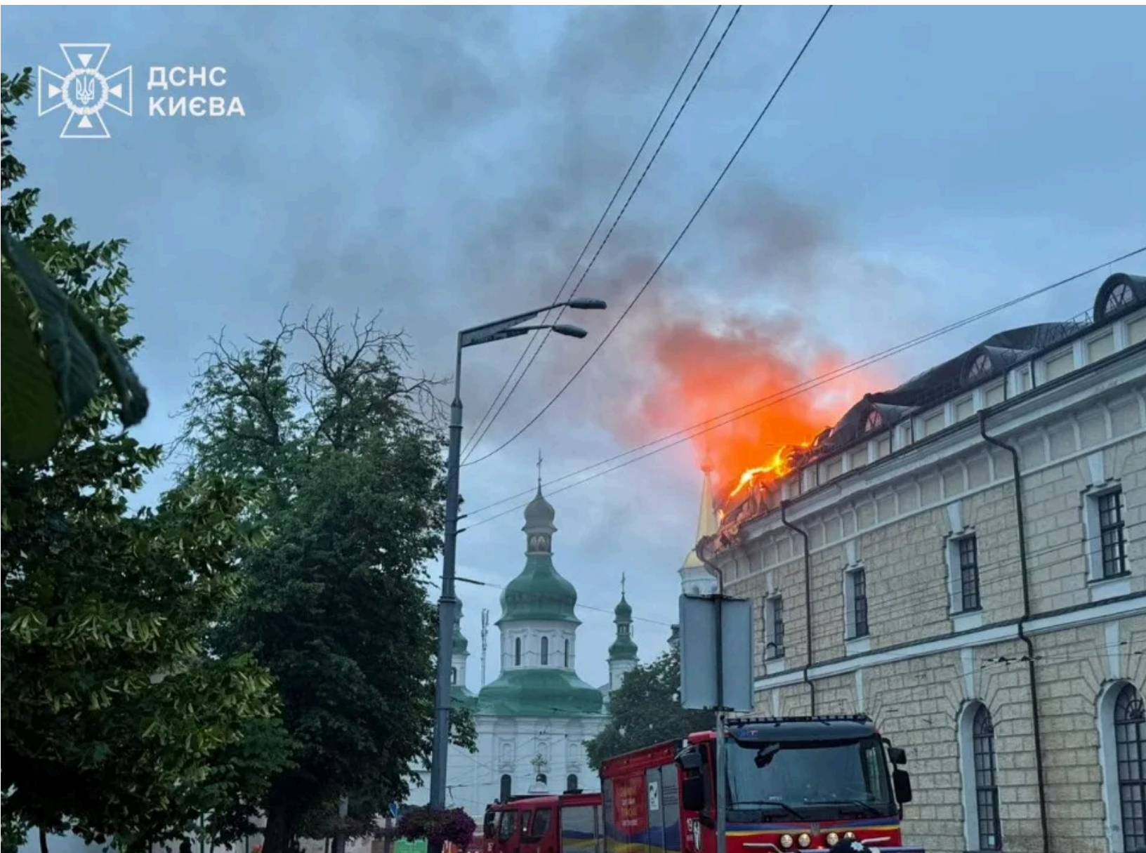
Росія атакувала цивільну інфраструктуру Києва

У Шевченківському районі пошкоджено житлові будинки, інфраструктурні об'єкти та підприємства.