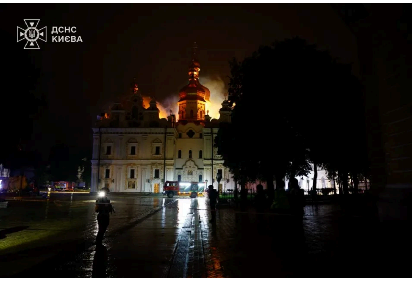
Внаслідок обстрілу постраждала Києво-Печерська лавра