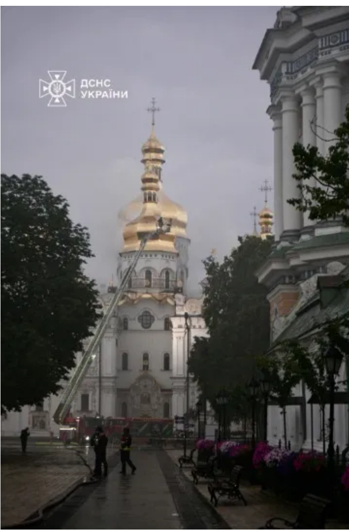
Внаслідок обстрілу постраждала Києво-Печерська лавра