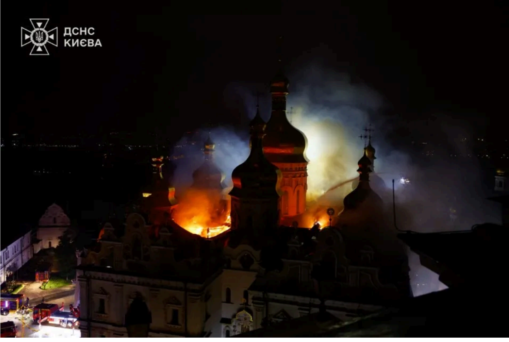
Внаслідок обстрілу постраждала Києво-Печерська лавра

У Печерському районі пошкоджено житло та об'єкти нежитлової забудови. Загоряння сталося в гуртожитку. Крім того, пожежа виникла на території Києво-Печерської лаври — там загорілася покрівля Успенського собору.