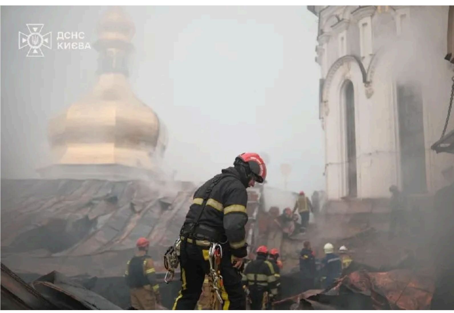
Внаслідок обстрілу постраждала Києво-Печерська лавра