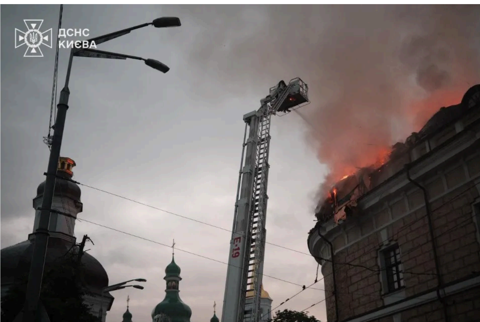
Внаслідок обстрілу постраждала Києво-Печерська лавра

У Дніпровському районі внаслідок падіння уламків також пошкоджено житлові будинки.