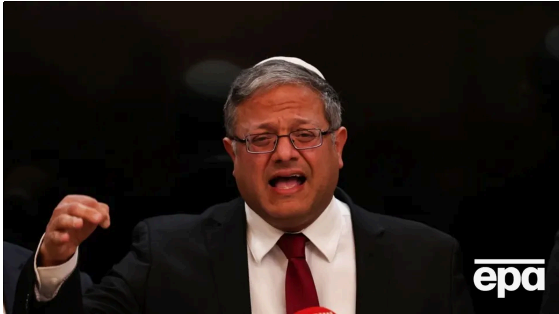
Бен-Гвір: Часи, коли євреї терпів удари й стримувався, минули

Ізраїль не вважає себе зобов'язаним виконувати угоду президента США Дональда Трампа з Іраном. Про це заявив міністр національної безпеки Ізраїлю Ітамар Бен-Гвір 15 червня в соцмережі X.