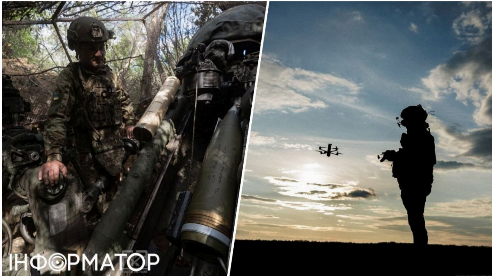
ЗСУ знищили вузол управління БПЛА біля Комара

Українська авіація завдала прицільних ударів по пунктах управління безпілотниками росіян у районі Комара на Донеччині. Підтверджено ураження ворожої інфраструктури управління дронами - цілей, що безпосередньо забезпечують розвідку та наведення вогневих засобів на передньому краї. Знищення таких об'єктів суттєво підриває здатність противника контролювати ситуацію на фронті та координувати удари по українських позиціях і логістиці.