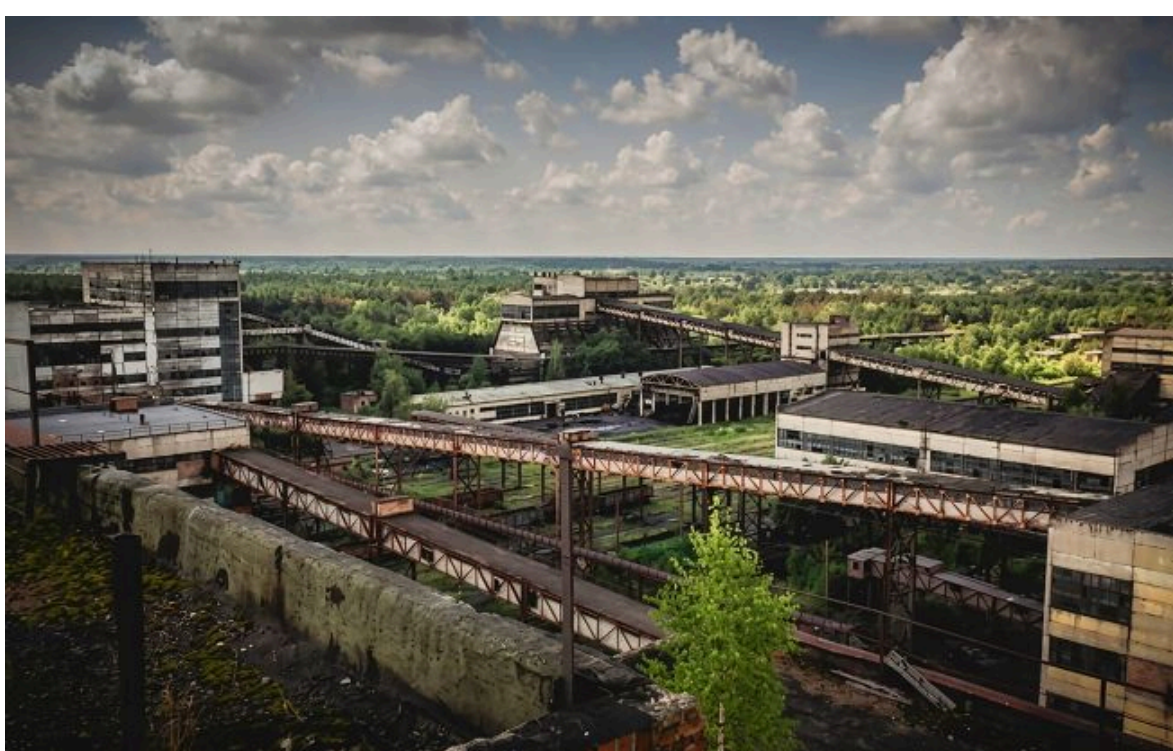
Червоноградська ЦЗФ простоює через затяжні суди