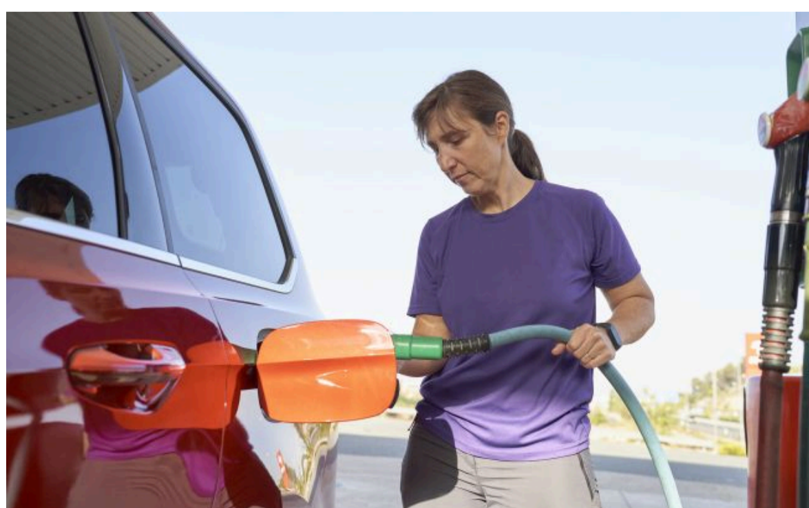
Фото: Ціни на пальне після вихідних трохи змінилися (Getty Images)

Не витрачай час на шум! Читай тільки суть з РБК-Україна у Google