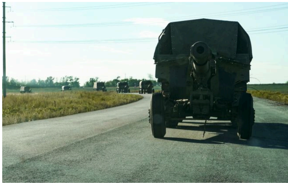
Фото: перекрито одну з ключових доріг на Донеччині