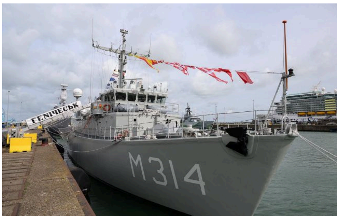
Фото: Україна отримала від Нідерландів новий корабель "Генічеськ" (facebook.com/GeneralStaff.ua)