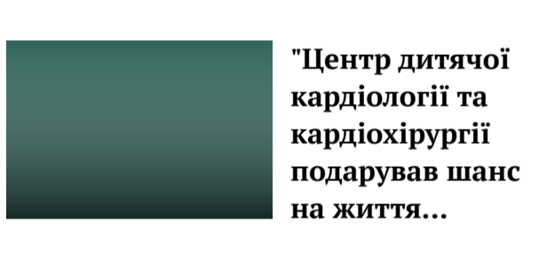
"Центр дитячої кардіології та кардіохірургії подарував шанс на життя..."