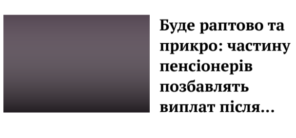
Буде раптово та прикро: частину пенсіонерів позбавлять виплат після...