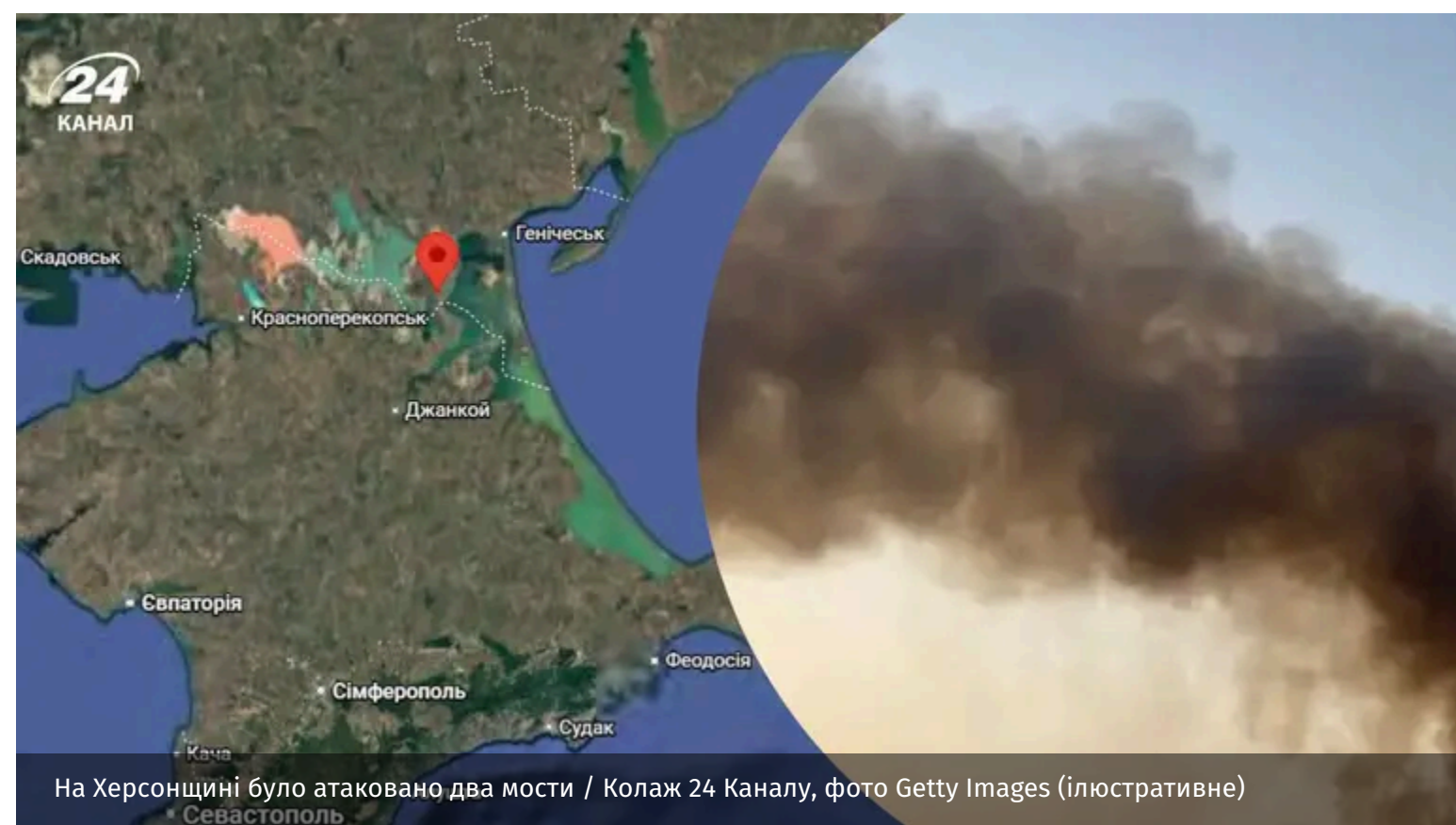
На Херсонщині було атаковано два мости

Схоже, "добрі" дрони знову атакували окупантів на Херсонщині. Так, окупаційний "губернатор" Сальдо заявив про удари по двох мостах 15 червня.