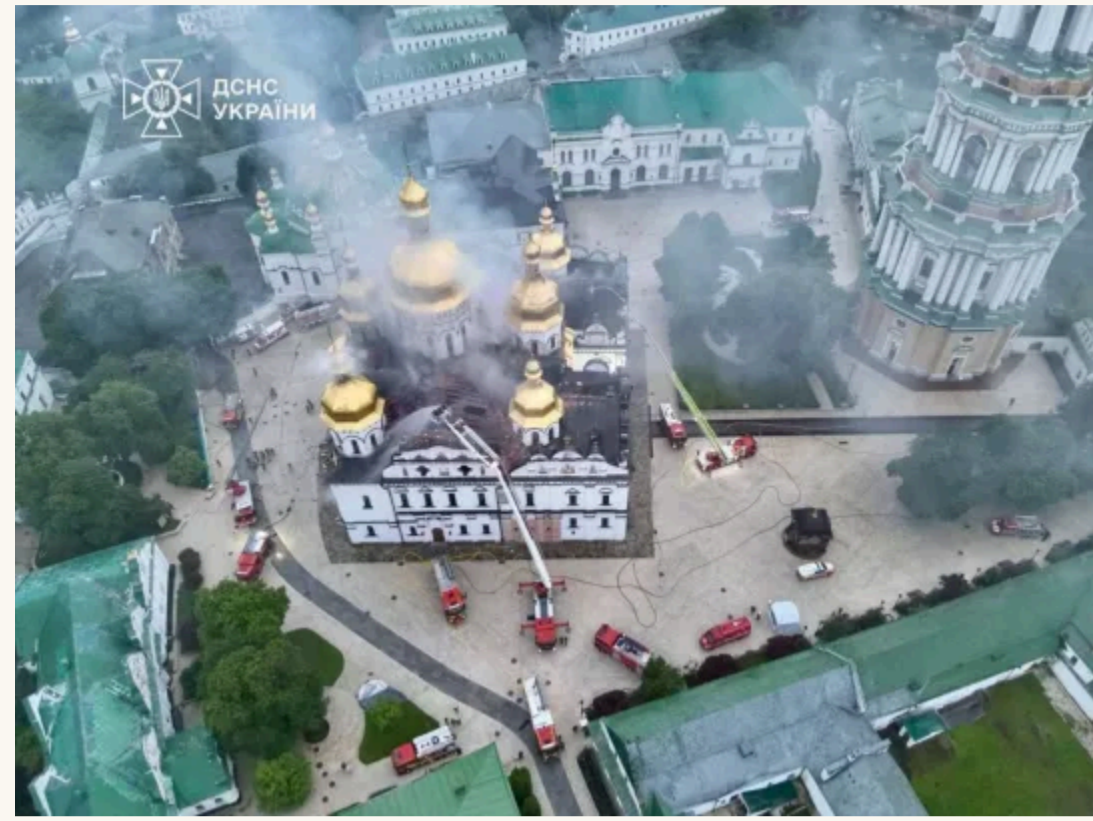
Іван МОЗГОВИЙ, «ФАКТИ»

В ніч на 15 червня росіяни запустили по Києву понад 60 ракет. Загалом по Україні було випущено 70 ракет і 611 дронів. Про це повідомив президент України Володимир Зеленський .