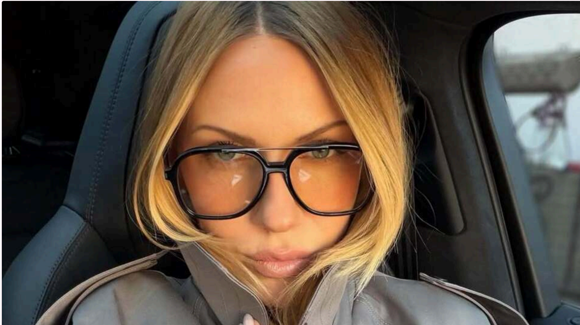
Нікітюк: Ховайтеся і ховайтеся глибше

15 червня, 11:35 📸 Цей матеріал також можна прочитати на русском